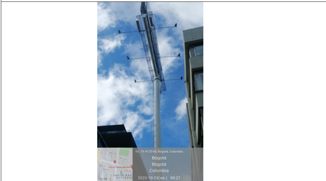
Foto 2. Detalle del mástil y de la estructura de la valla en buenas condiciones y estable.